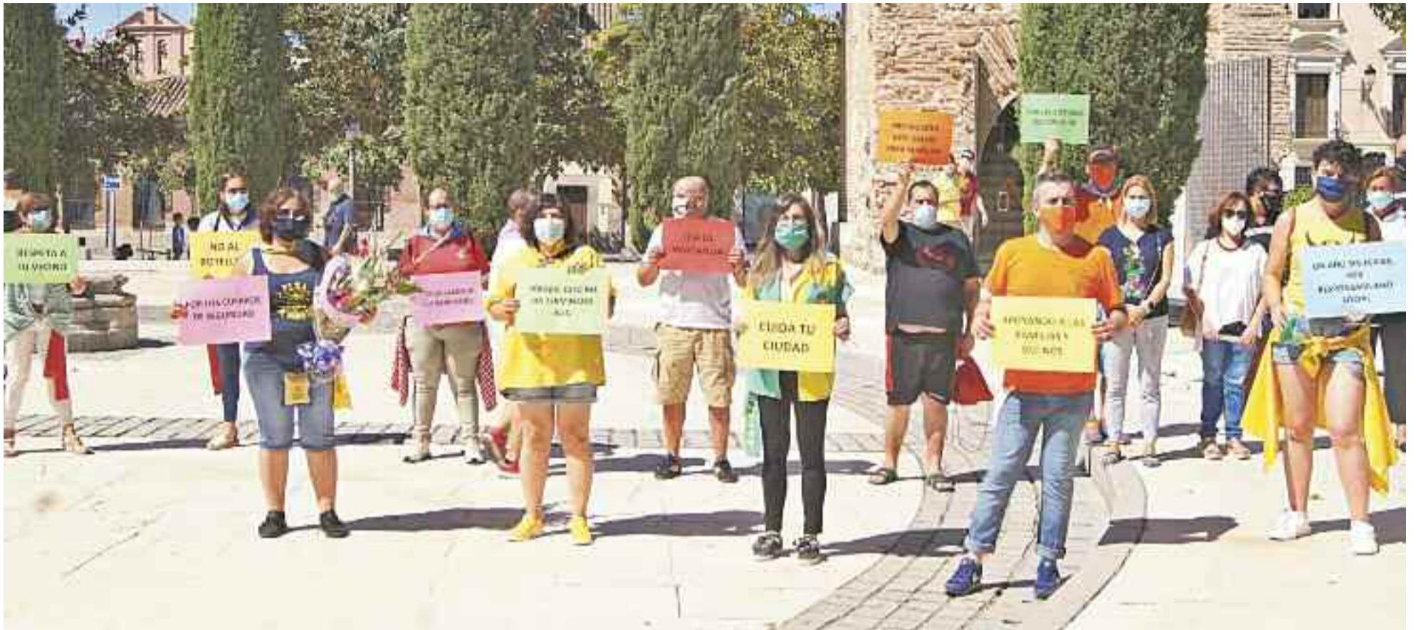
Acto simbólico en Alcalá de Henares con homenaje a las víctimas del COVID-19 en el día que debería marcar el inicio de las Ferias 2020